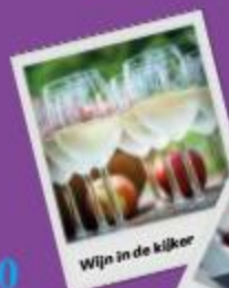
Wijn in de kijker

Vraag je stempelkaart bij het eerste wijndomein dat je bezoekt of download deze op www.toerismevlaamsbrabant.be/wijn . Met de kaart geniet je van een gratis amuse bij je glaasje Hagelandse wijn en maak je bovendien kans op een wijnpakket- of arrangement.