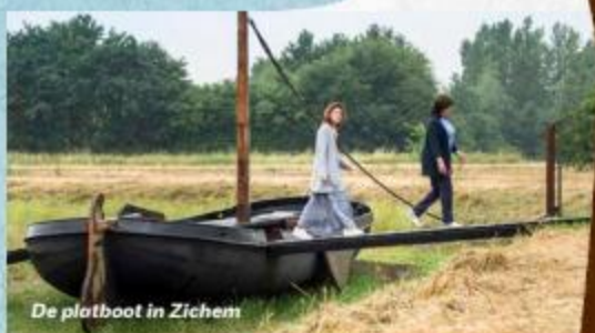
De platboot in Zichem

Jaagpad Demer, 400m ten oosten van de NZ1-brug over de Dijle in Werchter vanaf oktober 2017