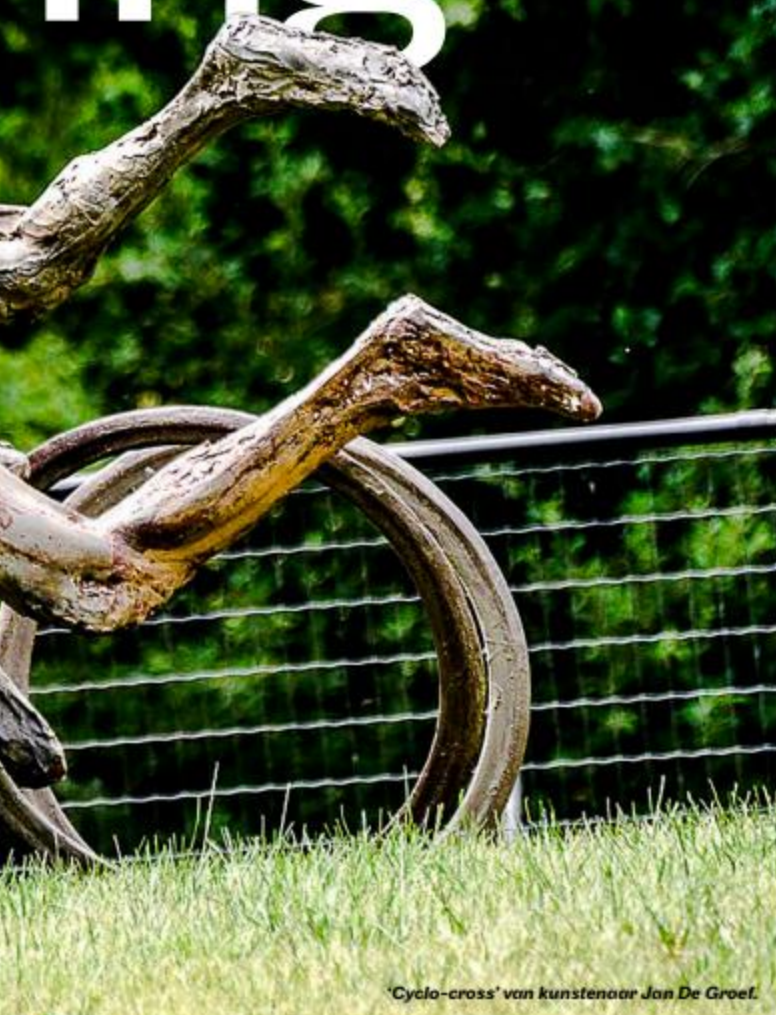
'Cyclo-cross' van kunstenaar Jan De Groef.